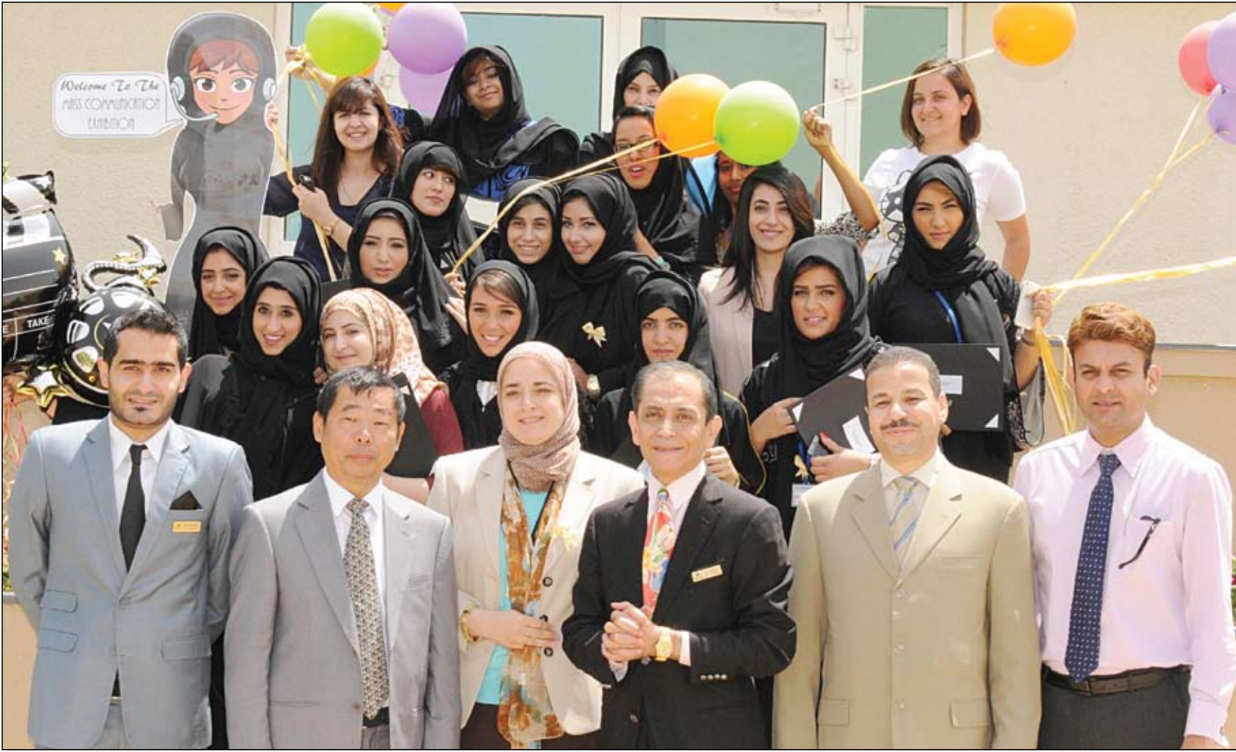
افتتاح المعرض الإعلامي الأول بجامعة أبوظبي بالعين